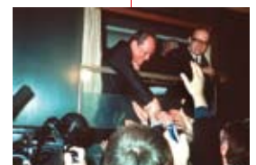
1970 Beim Besuch von Willy Brandt jubeln die DDR-Bürger dem neuen Kanzler der BRD zu.