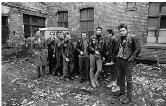
»Part of the old world lives on this island in Germany« sang die britische Band »Fischer-Z«: Rocker, oder besser Teds in einem Hinterhof