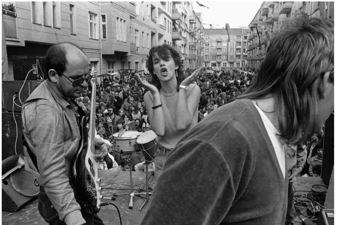
Musikalisch den Aufstand proben: An Rockfans herrschte in der DDR kein Mangel

Volksaufstand in Ungarn, Protest an den Universitäten der DDR, Gründung der Nationalen Volksarmee (NVA).