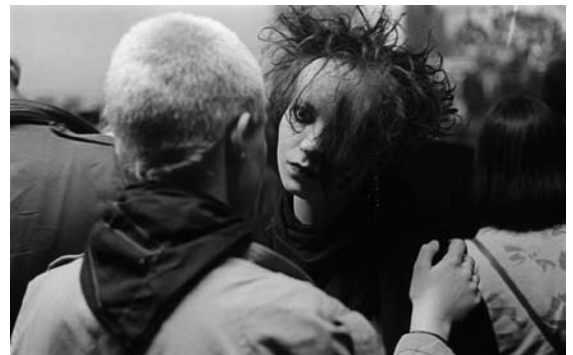
Schau mir in die Augen: Die Frauen waren in der DDR emanzipierter, auch die Punkerinnen

Auch wenn die »Härte gegen Punk«-Episode den Höhepunkt staatlicher Repression gegen Jugendliche darstellte, war das Misstrauen der DDR-Führung chronisch gegenüber allen, die anders sein wollten. Insbesondere, wenn man die bürgerliche Dekadenz des Westens dahinter witterte. Schon Rock 'n' Roll roch nach Ärger. Walter Ulbricht sah im hüftenschwingenden Elvis ein gefährliches Geschütz im Kalten Krieg. Die Beatles galten im Kulturministerium als Motor der imperialistischen Propagandamaschinerie, die langhaarigen Hippies als maskierte Klassenfeinde. Wann immer neue Jugendbewegungen entstanden, versuchte man sie mit aller Macht zu unterdrücken. Scheiterte dies, was in der Regel der Fall war, probierte man sie zu vereinnahmen und erfand eigene Musikrichtungen, die sich an die Westimporte anlehnten: Da man Rock nicht verbieten konnte, wurde Anfang