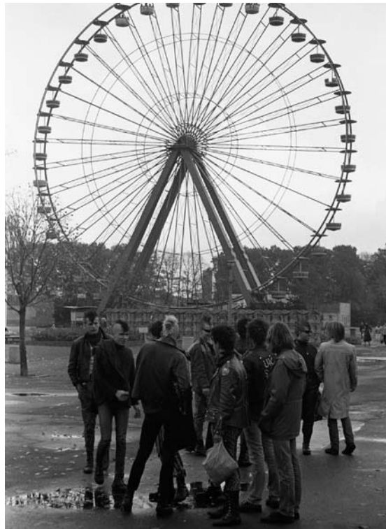
Beliebter Treff der Punks: Freizeitpark Plänterwald in Berlin Treptow

erste DDR-Indie-Disco aufzogen. »Die machten da Filmabende und Töpfernachmittage, also öde Komplettbetreuung«, erinnert sich Galenza – mehr als 15 Besucher kamen selten zu den braven FDJ-Veranstaltungen. Einer seiner Freunde hatte beim