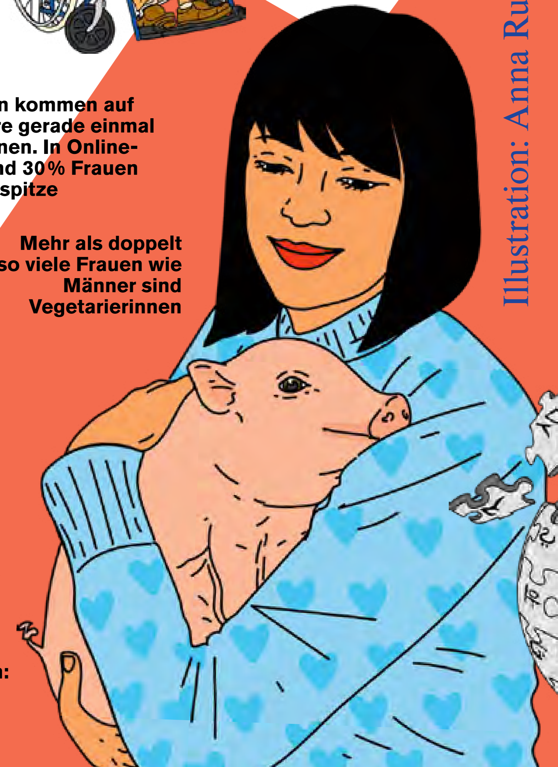
Illustration: Anna Rupprecht

Mehr als doppelt so viele Frauen wie Männer sind Vegetarierinnen