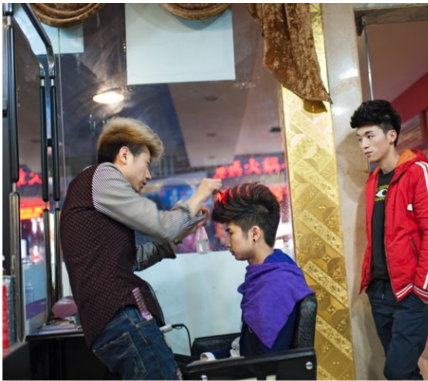
Die Jugend zwischen den Stühlen: Man sollte sich nicht allzu kritisch über die Regierung äußern, aber bei der Frisurenwahl ist man frei

Regel Konsequenzen. Sie reichten von Geldstrafen und Kündigungen bis zu Zwangsabtreibungen und -sterilisation.