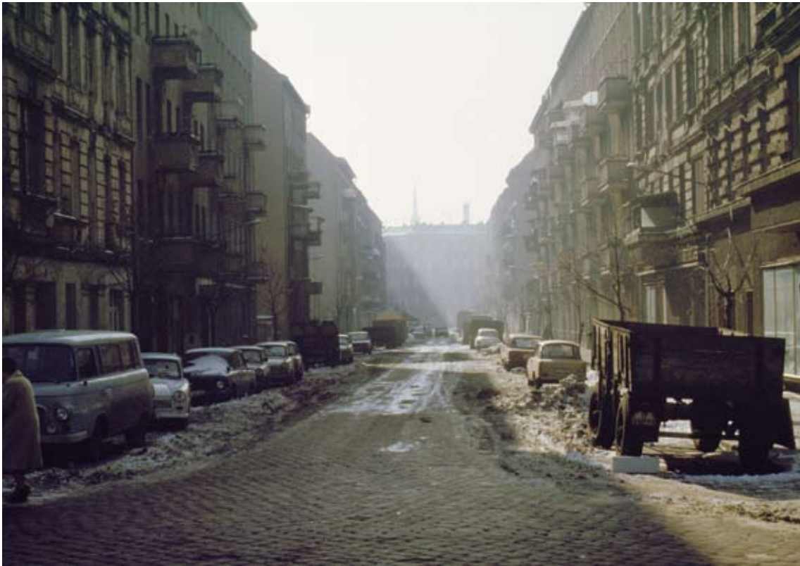
Nicht so schick wie heute: So sah der Prenzlauer Berg vor dem Mauerfall aus (1989)

So war es ja eher Wasser predigen und Wein trinken. Auf der einen Seite schimpfte man auf den Westen, auf der anderen bot man den Privilegierten die Westwaren im Intershop an.