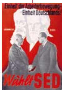
1946 – Gründung der SED Die SPD und die KPD werden zur Sozialistischen Einheitspartei Deutschlands (SED) zwangsvereinigt.

fluter: Herr Wolle, war es nicht vielleicht eine gute Idee, nach dem Zweiten Weltkrieg mit den Ungleichheiten des Kapitalismus aufzuräumen und nach dem Faschismus mit der DDR eine gerechtere Gesellschaft zu schaffen?