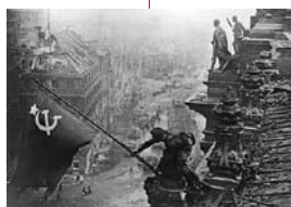
1945 – Ende des II. Weltkriegs In der sowjetischen Besatzungszone werden die Großgrundbesitzer und Industriellen enteignet.