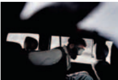
Mitte Die amerikanische DEA und afghanische Polizei auf der Suche nach Drogenlaboren